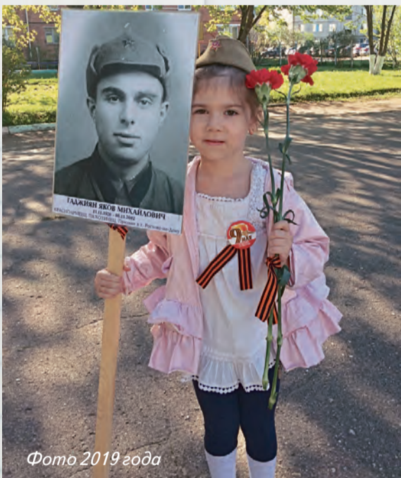
Фото 2019 года