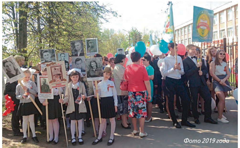
Фото 2019 года

В этом году Россия празднует 75-летие Великой Победы. За освобождение страны и мира от фашистской угрозы русские люди заплатили огромную цену. Но живет в наших сердцах память об их жертве, а наши дети знают, пусть только по рассказам и старым пожелтевшим фотографиям, своих прабабушек и прадедов, помнят их и гордятся своими предками. И детские послания уже ушедшим, которые мы публикуем сегодня, - лучшее тому доказательство