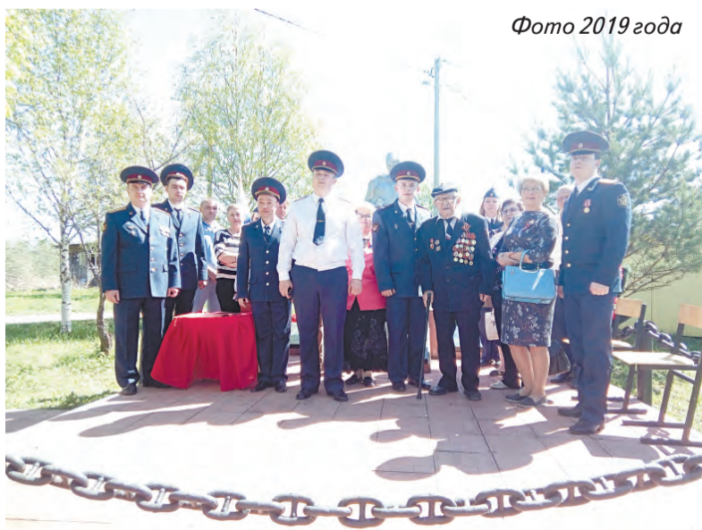
Фото 2019 года

Руководство и личный состав ФКУ СИЗО-2 УФСИН России по Московской области